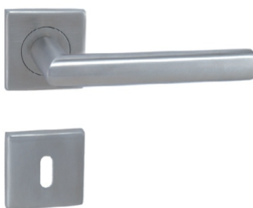
KOVÁNÍ MP FAVORIT - HR