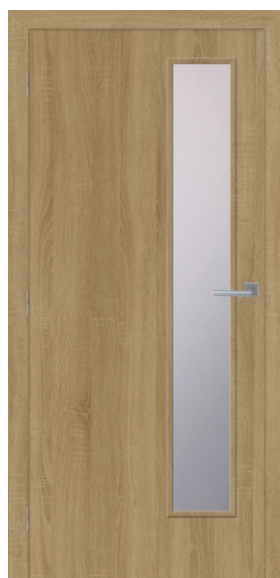
MODEL M212 BARDOLINO