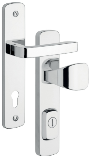
BEZPEČNOSTNÍ KOVÁNÍ ROSTEX R1 ASTRA (NEREZ MAT) KLIKA / MADLO