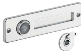
HRANATÉ KUKÁTKO SE JMENOVKOU ROSTEX