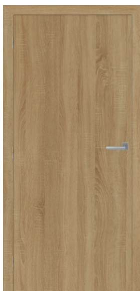
MODEL M101 BARDOLINO